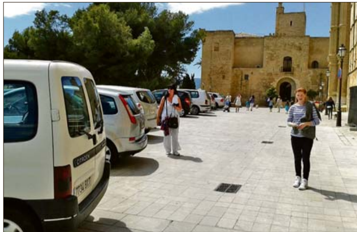
A partir del día 18 no se podrá aparcar en el mirador de la Seu. J. C.

En relación a las quejas de los vecinos por la supresión de los estacionamientos situados en el Mirador, Ferrer recordó que la decisión se ha adoptado cuando se ha podido ofrecer a los afectados una alternativa, consistente en la adquisición de un abono en el es-