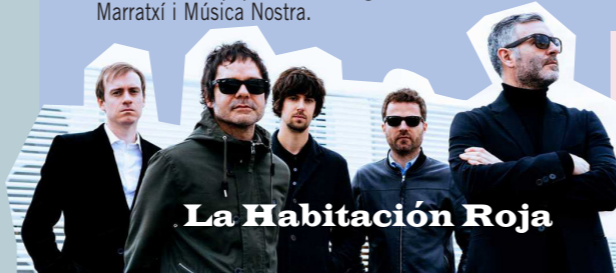
La Habitación Roja