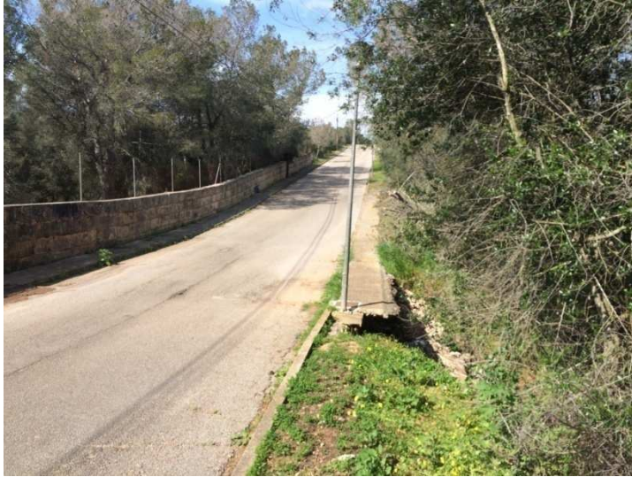
Zona a consolidar – direcció N