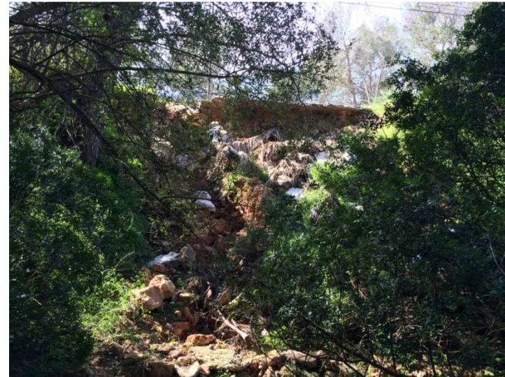
Vista del talud desde la zona inferior