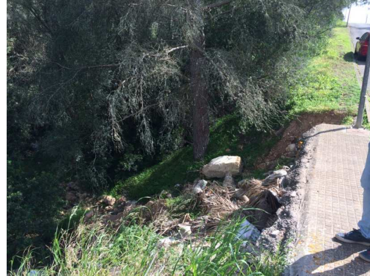
Zona a consolidar – direcció S