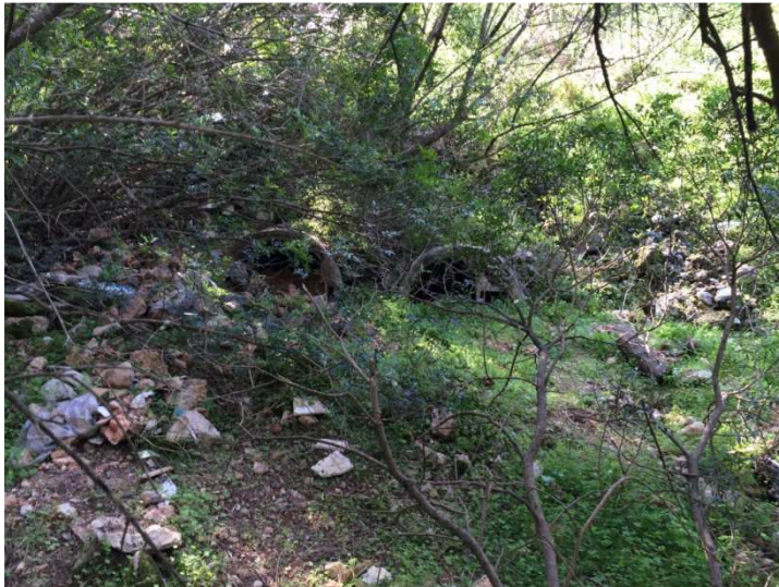
Vista de los tubos de drenaje transversal de la calle